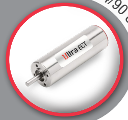
30ECT64/90 Ultra EC