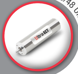
22ECT35/48 Ultra EC