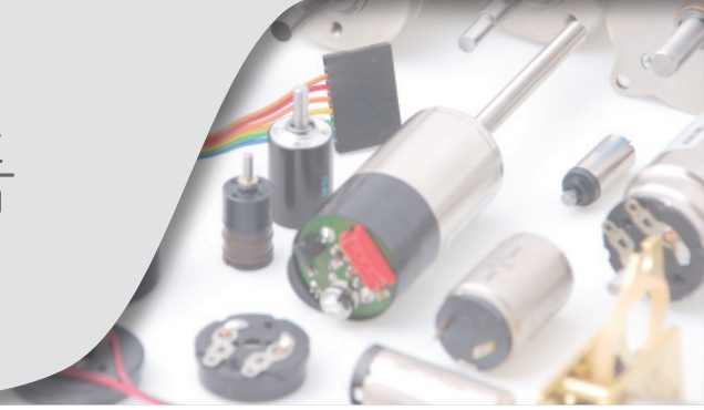
소형 뼈 모터