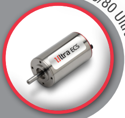
35ECS60/80 Ultra EC